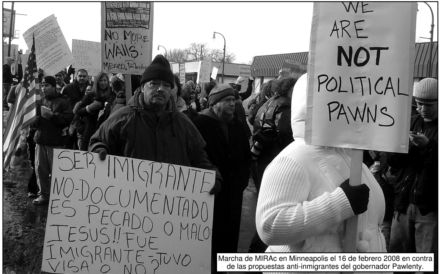
Marcha de MIRAC en Minneapolis el 16 de febrero 2008 en contra de las propuestas anti-inmigrantes del gobernador Pawlenty.