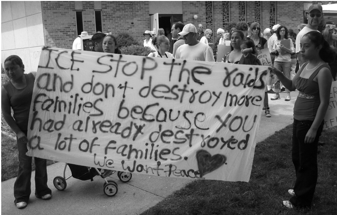
Más de mil inmigrantes y aliados marcharon el 27 de Julio para protestar la redada anti-inmigrante masiva del 12 de mayo en Agriprocessors en la ciudad Postville, Iowa.

** Gestapo La Gestapo, policía política y secreta fue fundada por Hermann Goering, ministro presidente de Prusia y uno de los principales lugartenientes de Adolf Hitler, en abril de 1933. Su función era perseguir a los enemigos del régimen, incluyendo los judíos. A la Gestapo se le atribuyen graves violaciones a los derechos humanos.